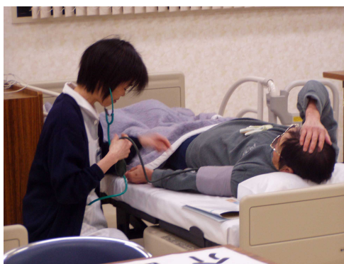
血管年齢測定の様子

『みて・ふれて・役立つ体験教室』ということで、当日は実際に介護用品やオムツのサンプル等を手にとって見ていただきました。また、汁物等にむせやすい方がむせなく飲めるように、とろみ剤でとろみを付けたジュースの試飲をされたり、体におもりの入ったプロテクター