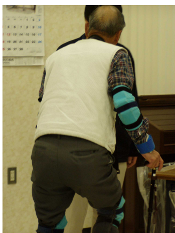
高齢者擬似体験の様子

を装着し段差を昇降する高齢者擬似体験を経験されました。なかでも、体重と身長から分かる肥満度チェックや血管年齢測定は、特に皆様の関心が高かったようです。体験や測定結果から、より一層ご自身の健康に対する意識が高まったのではないのでしょうか。